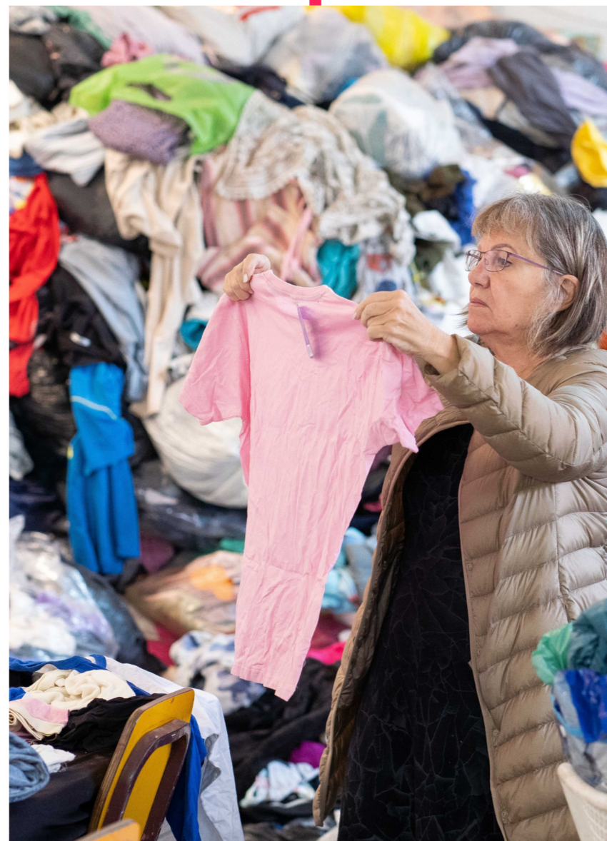
Re-Fresh Global sammelt und bereitet Textilabfälle auf.