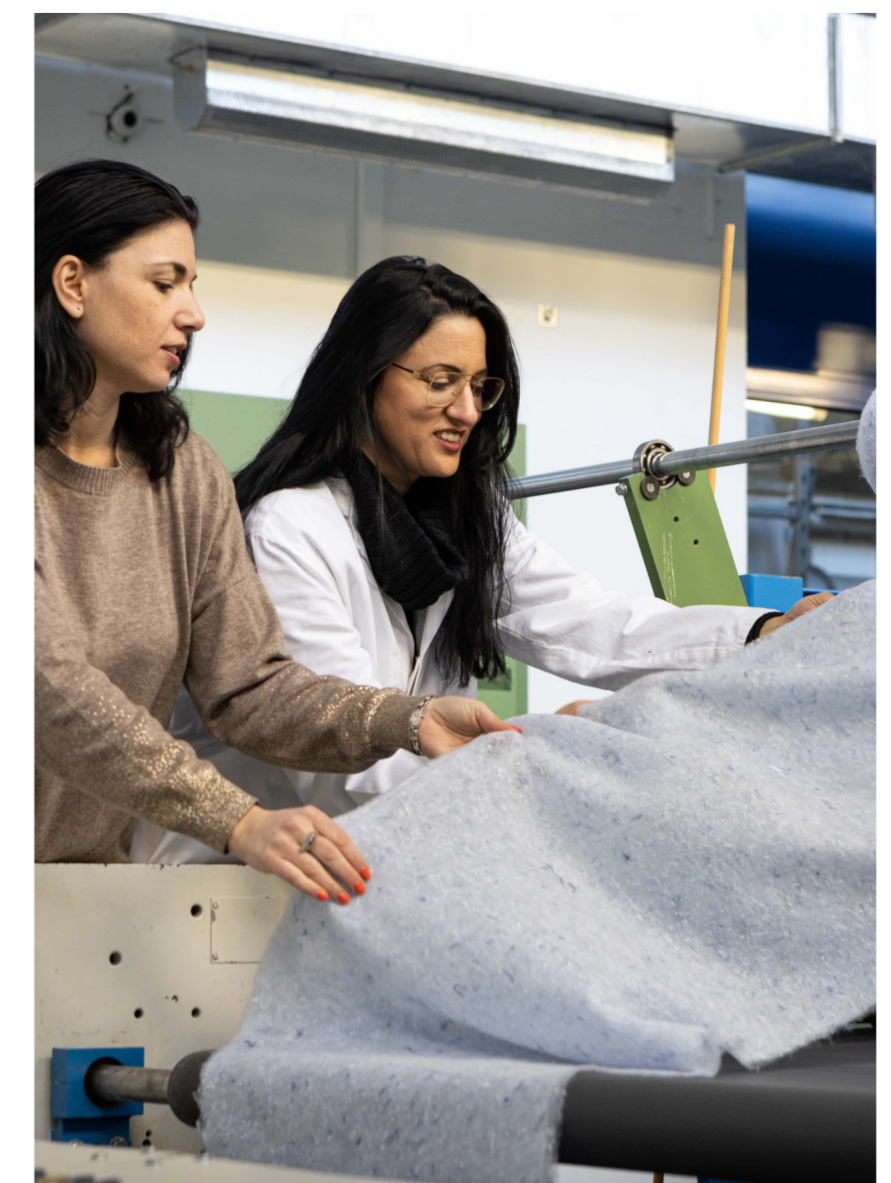
Re-Fresh Global entwickelt mit Partnern Produktmuster.