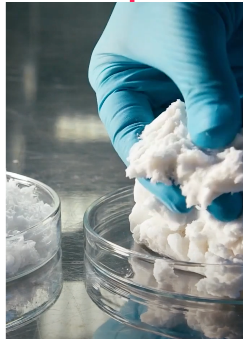
Am TITV werden in geeigneten Mengen erzielte Materialien untersucht und bereitgestellt.